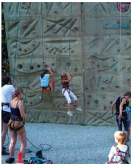
Mala šola plezanja