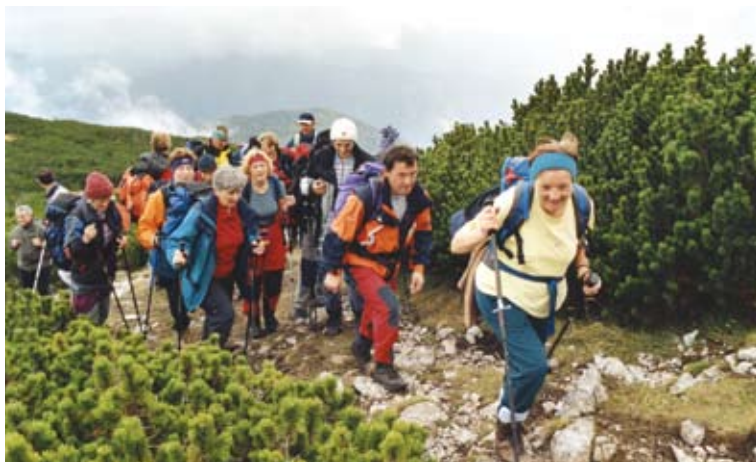
Jesenski izlet na Peco, 2001