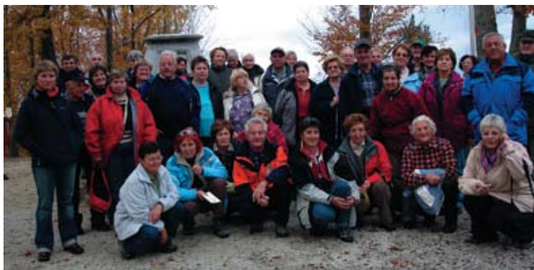
Izlet v neznano - Goričko, november 2006