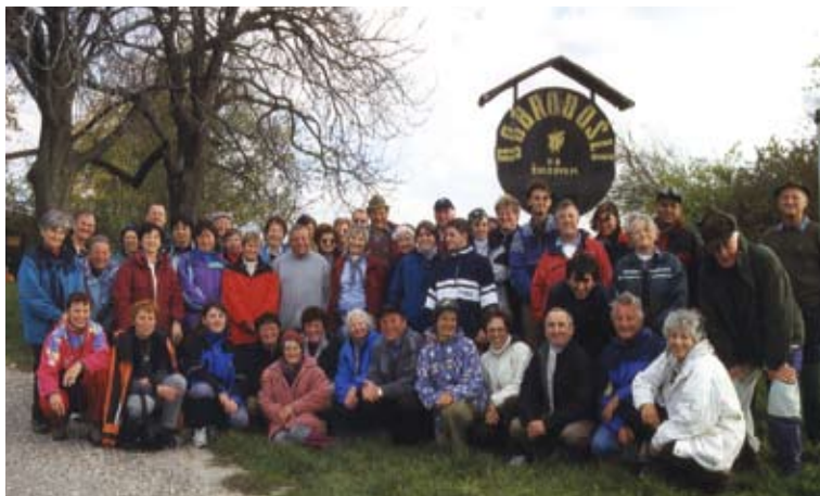
Izlet PD Gozd Martuljk na Ptujsko goro in v Haloze, 12. november 2000