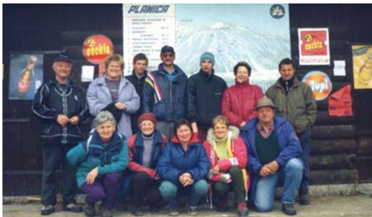
Planica po Planici, 2002