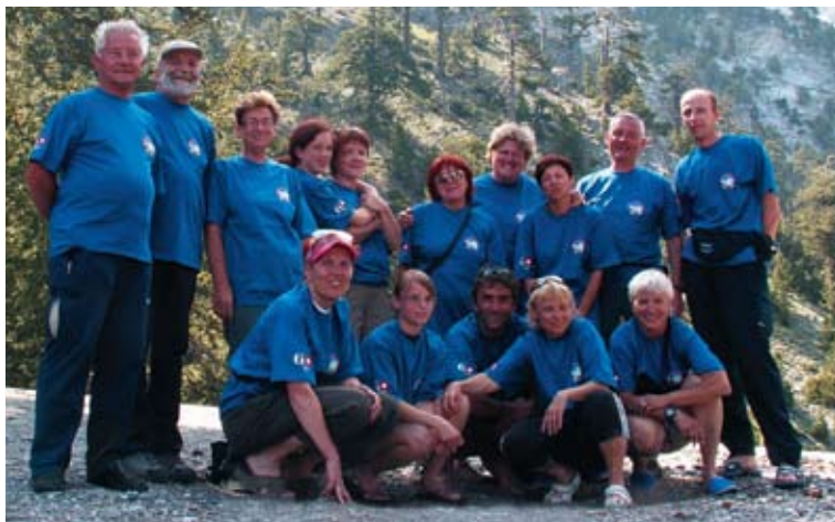
Člani odprave Olimp 2009