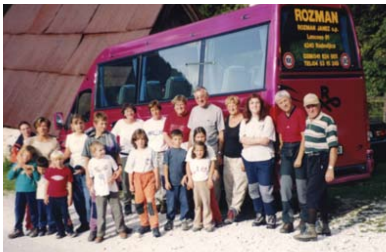
“Gasilska” na koncu prehojene poti, Krnska jezera