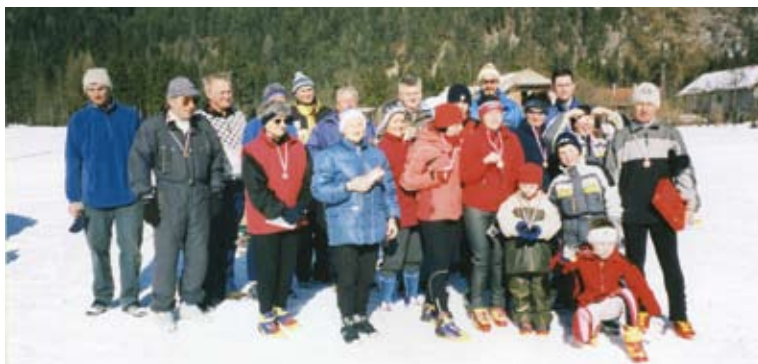
Skupinska po teku na smučeh, 2005