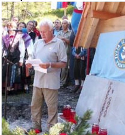
Odkritje spominskega obeležja. Jasenje, avgust 2007

Izleti društva: Primorska (Lačna, Kuk, Krog, Kirik), Iški Vintgar, Kremžarjev vrh, Stegovnik, Košutica, Tolminski Kuk, Veliki Nabojs, Kriška stena - Vrata, izlet v neznano - Rezija - Čedad - Goriška Brda in decembrski izlet na Limbarsko goro.