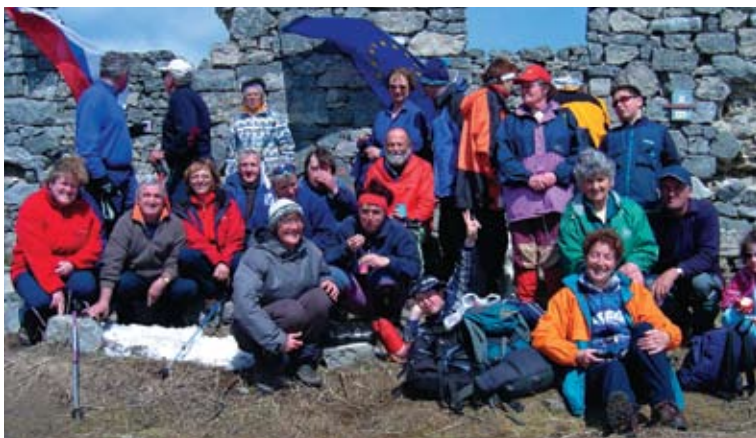
Na Vošci ob vstopu Slovenije v EU, 2. maj 2004

Ob koncu leta pa še nova pridobitev, in sicer ureditev spletne strani društva.