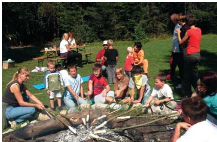
Igrajmo se v Rutah, 2008